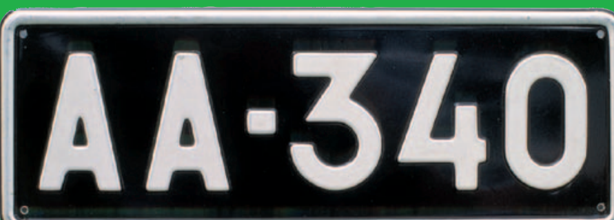
Auton mustapohjainen lyhyt kilpi