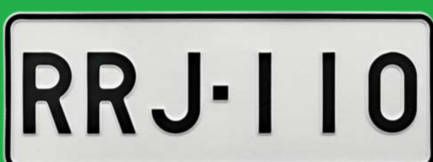
Auton valkopohjainen pieni kilpi