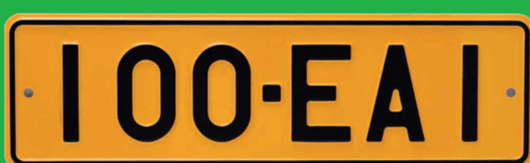
Traktorin ja moottorityökoneen kilpi