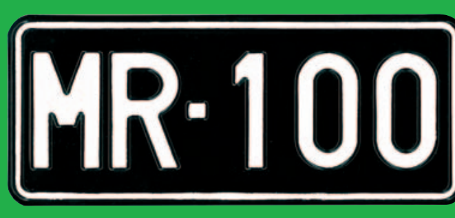
Museomoottoripyörän kilpi M-alkuinen