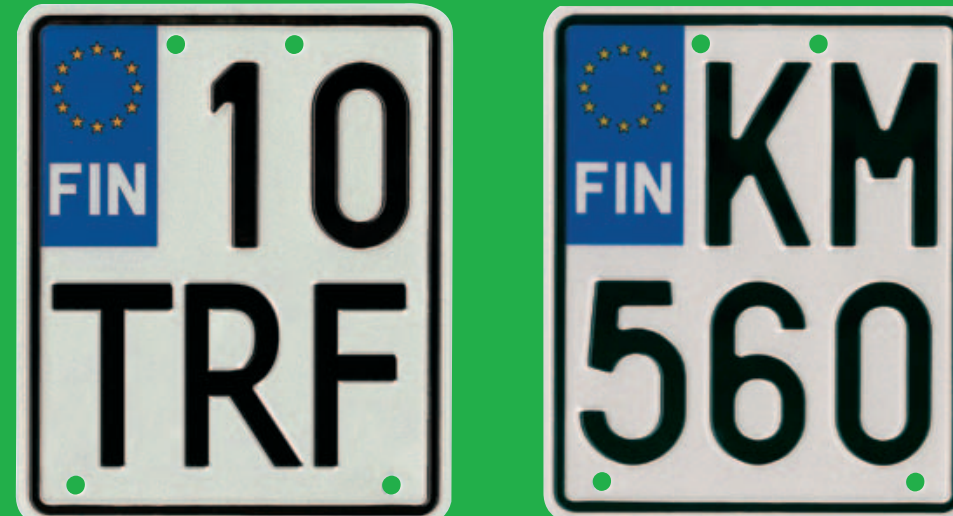
Moottoripyörän ja nelipyörän EU-kilpi