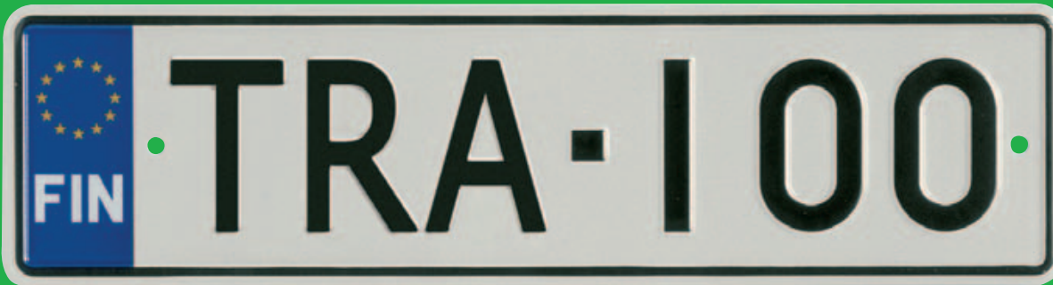
Auton matala EU-kilpi