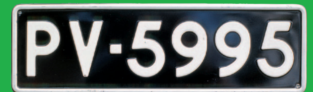
Perävaunun mustapohjainen kilpi (ei enää myönnetä)