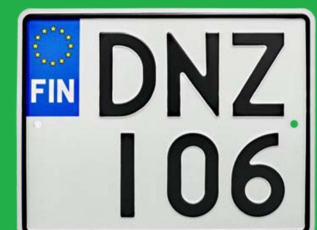
Perävaunun korkea EU-kilpi