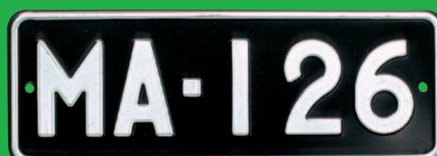
Museoauton kilpi M-alkuinen