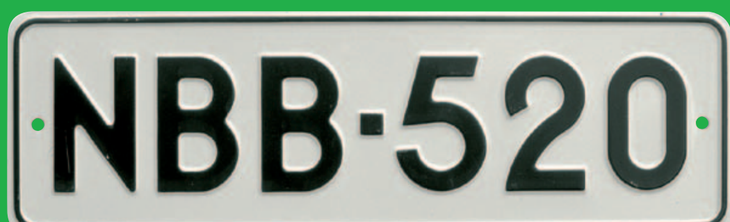
Auton valkopohjainen pitkä kilpi